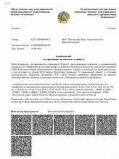
Разрешение на применение аппаратов емкостных на территории Республики Казахстан