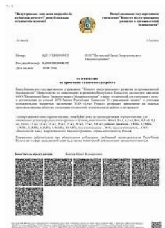
Разрешение на применение аппаратов емкостных на территории Республики Казахстан