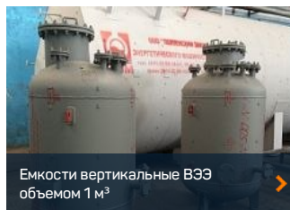
Емкости вертикальные ВЭЭ объемом 1 м³