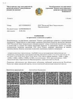
Разрешение на применение аппаратов емкостных на территории Республики Казахстан