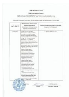
Декларация TR TC 032 на сосуды 1-й и 2-й категории Приложение 1