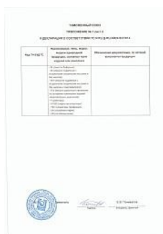
Декларация TR TC 032 на сосуды 1-й и 2-й категории Приложение 2