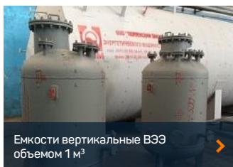
Емкости вертикальные ВЭЭ объемом 1 м 3