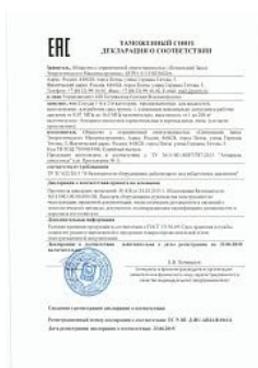
Декларация TR TC 032 на сосуды 1-й и 2-й категории