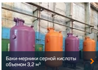
Баки-мерники серной кислоты объемом 3,2 м 3