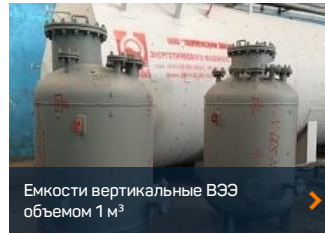
Емкости вертикальные ВЭЭ объемом 1 м 3