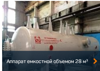
Аппарат емкостной объемом 28 м 3