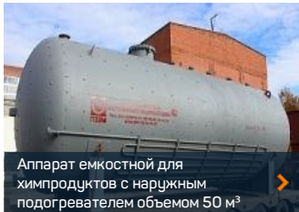
Аппарат емкостной для химпродуктов с наружным подогревателем объемом 50 м 3