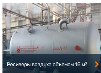
Резервуары воздуха объемом 16 м³