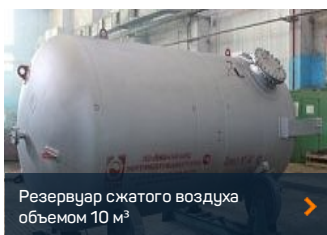
Резервуар сжатого воздуха объемом 10 м³