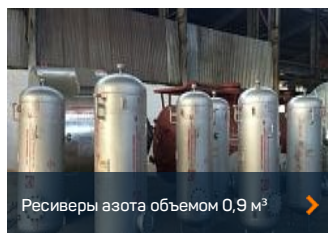
Ресиверы азота объемом 0,9 м³