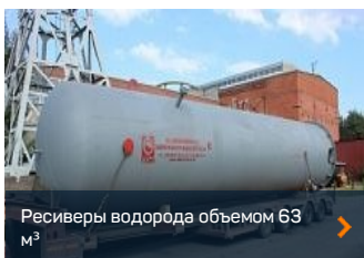
Ресиверы водорода объемом 63 м³