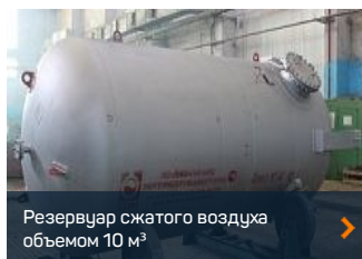
Резервуар сжатого воздуха объемом 10 м³