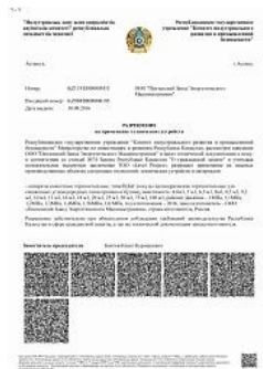
Разрешение на применение аппаратов емкостных на территории Республики Казахстан