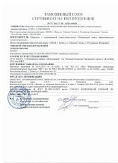
Сертификат ТР ТС 010 на аппараты емкостные