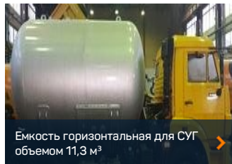
Емкость горизонтальная для СУГ объемом 11,3 м³