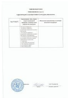
Декларация ТР ТС 032 на сосуды 1-й и 2-й категории Приложение 2