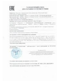
Декларация ТР ТС 010 на аппараты емкостные