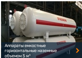
Аппараты емкостные горизонтальные наземные объемом 5 м³