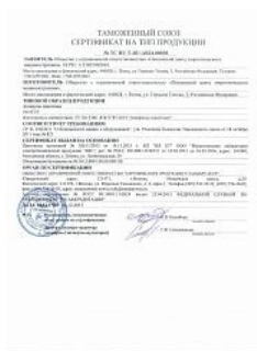
Сертификат ТР ТС 010 на аппараты емкостные