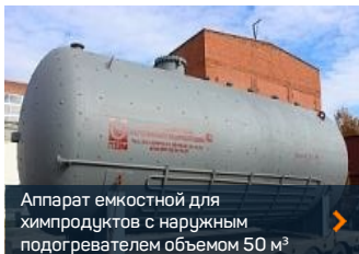
Аппарат емкостной для химпродуктов с наружным подогревателем объемом 50 м³