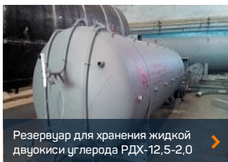
Резервуар для хранения жидкой двуокси углерода РДХ-12,5-2,0 >