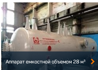
Аппарат емкостью объемом 28 м 3 >