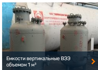
Емкости вертикальные ВЭЭ объемом 1 м 3 >