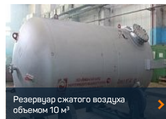
Резервуар сжатого воздуха объемом 10 м 3 >