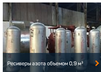
Ресиверы азота объемом 0,9 м 3 >