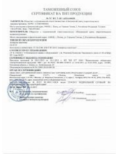
Сертификат ТР ТС 010 на аппараты емкостные