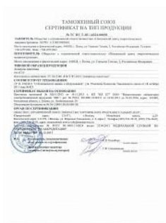
Сертификат TR TC 010 на аппараты емкостные