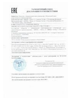
Декларация ТР ТС 010 на аппараты емкостные