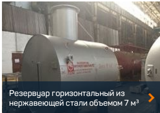
Резервуар горизонтальный из нержавеющей стали объемом 7 м³