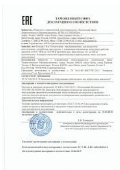
Декларация ТР ТС 032 на сосуды 1-й и 2-й категории