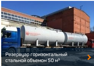
Резервуар горизонтальный стальной объемом 50 м 3