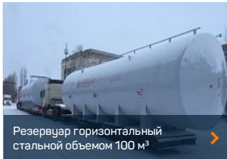
Резервуар горизонтальный стальной объемом 100 м³