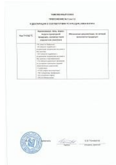
Декларация ТР ТС 032 на сосудах 1-й и 2-й категории Приложение 2