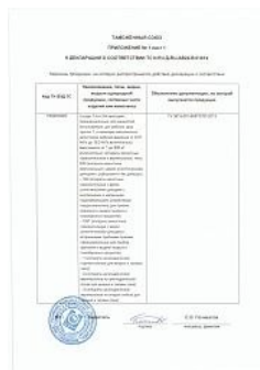
Декларация ТР ТС 032 на сосудаы 1-й и 2-й категории Приложение 1