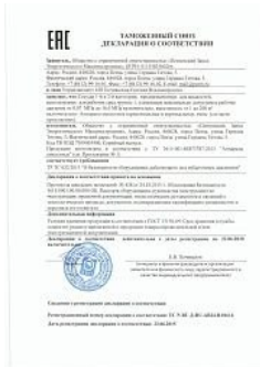
Декларация ТР ТС 032 на сосудах 1-й и 2-й категории