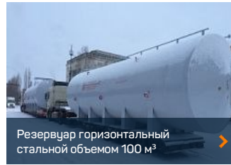
Резервуар горизонтальный стальной объемом 100 м³