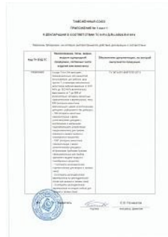
Декларация ТР ТС 032 на сосудах 1-й и 2-й категории Приложение 1