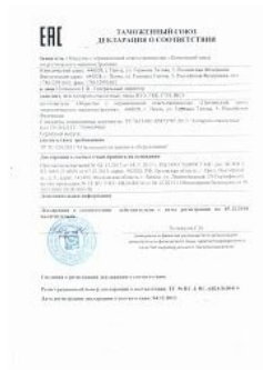
Декларация ТР ТС 010 на аппараты емкостные