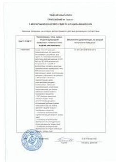
Декларация ТР ТС 032 на сосуды 1-й и 2-й категории Приложение 1