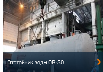
Отстойник воды ОВ-50