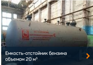
Емкость-отстойник бензина объемом 20 м 3