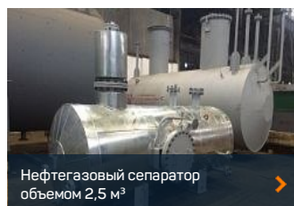
Нефтегазовый сепаратор объемом 2,5 м 3