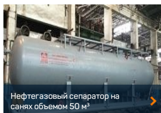
Нефтегазовый сепаратор на санях объемом 50 м 3