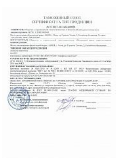
Сертификат TP TC 010 на аппараты емкостные