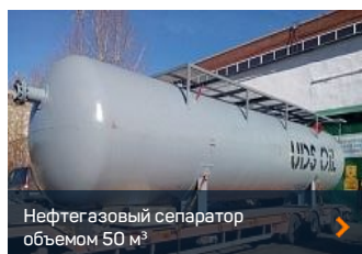
Нефтегазовый сепаратор объемом 50 м 3