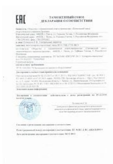
Декларация TP TC 010 на аппараты емкостные