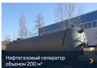
Нефтегазовый сепаратор объемом 200 м 3